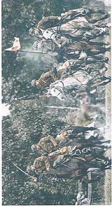
Rekonstrukcja bitwy pod Tomiankami z 1939 roku.